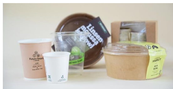
Abbildung 1. Wer Einwegplastik wie beschichtete Papp- oder Bioplastikverpackungen für die Bereitstellung von Essen und Trinken verwendet, muss künftig auch Mehrwegalternativen anbieten.

Dabei ist unerheblich, ob die Behältnisse ganz oder teilweise aus Kunststoff bestehen. Auch wenn nur die Beschichtung Kunststoff enthält, fällt ein Behältnis unter die neuen Regelungen. Irrelevant ist ebenfalls, ob es sich um soge-