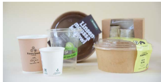
Abbildung 1. Wer Einwegplastik wie beschichtete Papp- oder Bioplastikverpackungen für die Bereitstellung von Essen und Trinken verwendet, muss künftig auch Mehrwegalternativen anbieten.

Dabei ist unerheblich, ob die Behältnisse ganz oder teilweise aus Kunststoff bestehen. Auch wenn nur die Beschichtung Kunststoff enthält, fällt ein Behältnis unter die neuen Regelungen. Irrelevant ist ebenfalls, ob es sich um sogenanntes Bioplastik handelt. 1