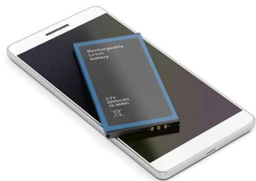
Abbildung 1: Gerätebatterien brauchen verpflichtende Ökodesignanforderungen

Im BattG ist es aktuell möglich, dass Rücknahmesysteme freiwillig finanzielle Anreize bzgl. der ökologischen Gestaltung der Herstellerbeiträge für Gerätebatterien setzen (§ 7a BattG). Allerdings ist dieses Anreizmodell nahezu unwirksam, da die Rücknahmesysteme über die Ausgestaltung der Anreize entscheiden und im finanziellen Wettbewerb zueinanderstehen. So können Hersteller umweltschädlicher Batterien zur Vermeidung höherer Kosten bei einem Rücknahmesystem schlicht zu einem System mit günstigeren Konditionen wechseln. Die DUH fordert, Rücknahmesysteme in Bezug auf alle Batteriekategorien zu verpflichten, bei der Gestaltung von Herstellerbeiträgen ökologische Kriterien einzubeziehen, um umweltfreundliche Batterien zu fördern. Dabei sollte es konkrete Vorgaben zur Ausgestaltung dieser Ökomodulation geben, beispielsweise indem ein Bonus-Malus-System für alle Rücknahmesysteme vorgegeben wird. Die Systematik sollte neben Aspekten wie Langlebigkeit, Wiederverwendbarkeit, Reparierbarkeit, Recyclingfähigkeit, CO 2 -Fußabdruck und Rezyklatgehalt, auch Anreize zur verringerten Nutzung von Primärbatterien setzen. Rücknahmesysteme, die keine ausreichende Ökomodulation umsetzen, sollten zudem wirksam sanktioniert werden.