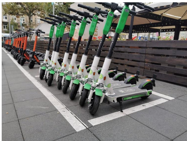
Abbildung 3: Für Batterien aus Leichten Verkehrsmitteln wie z.B. aus E-Scootern muss die Sammelstruktur deutlich verbessert werden, um neue EU-Vorgaben einzuhalten.

Da LV-Batterien bei falscher Entsorgung besonderen Risiken unterliegen und besonders viele Wertstoffe enthalten, sollte Deutschland ein Pfandsystem für diese Batterien etablieren. Auch wenn die EU-Batterieverordnung versäumt hat, eine Grundlage für ein EU-weites Pfandsystem zu etablieren, sollte die Bundesregierung über nationale Best-Practice-Beispiele den Weg für ein Europaweites Pfandsystem für LV-Batterien ebnen.