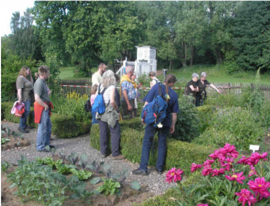
Führungen im Bauerngarten am Naturzentrum

Nettersheim ist aus gutem Grund das „Naturerlebnisdorf“. Hier befindet sich das Naturzentrum Eifel, dessen Angebot vom neugestalteten Ausstellungsbereich mit historischem Bauerngarten über familiengerechte Erlebnispfade und römische Tempelanlagen mitten im Grünen bis hin zu Aktivprogrammen für Schulklassen und Vereine reicht. Umweltbildung und Naturerlebnis werden in einzigartiger Kulturlandschaft vermittelt. Seit Neuestem wurde das Angebot auch für Menschen mit eingeschränkter Mobilität ausgebaut, indem das