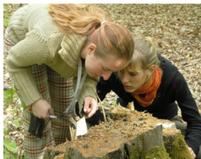
Naturerleben im Wald