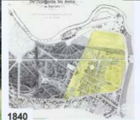
1840 Lenné Landschaftspark, Wiesenräume