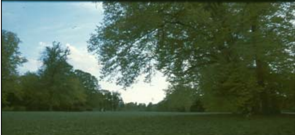
Park Sanssoussi Potsdam