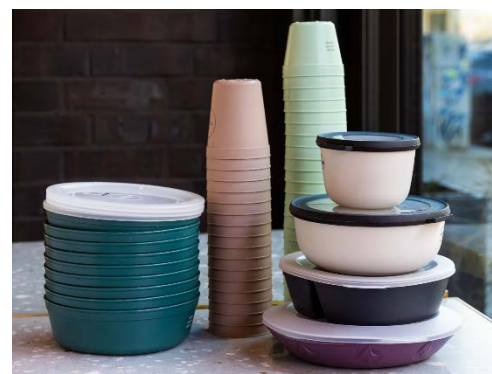
Abbildung 4. Pool-Mehrwegsysteme bieten bereits jetzt Mehrwegverpackungen in verschiedenen Größen und für unterschiedliche Verwendungszwecke an.

Eine gute Übersicht über verschiedene Materialien bei Mehrweg bietet der DUH-Einkaufsratgeber Takeaway . In klimabewussten Gastronomiebetrieben sollte nur Mehrweg angeboten werden – um den Anteil sukzessive zu steigern, ist eine aktive Kund*innenansprache wichtig.