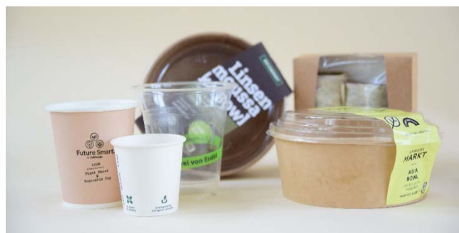
Abbildung 1. Wer Einwegplastik wie beschichtete Papp- oder Bioplastikverpackungen für die Bereitstellung von Essen und Trinken verwendet, muss künftig auch Mehrwegalternativen anbieten.

Dabei ist unerheblich, ob die Behältnisse ganz oder teilweise aus Kunststoff bestehen. Auch wenn nur die Beschichtung Kunststoff enthält, fällt ein Behältnis unter die neuen Regelungen. Irrelevant ist ebenfalls, ob es sich um sogenanntes Bioplastik handelt. 1