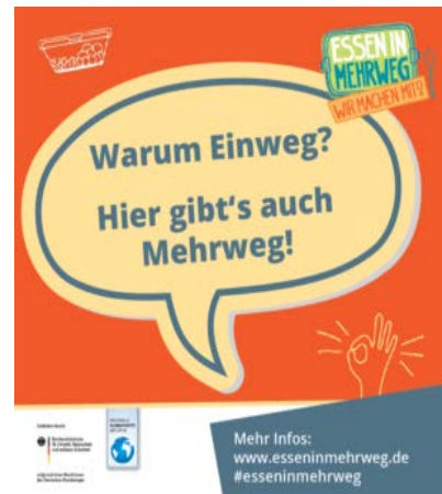
Abbildung 2. Mit so einem Schild könnte zum Beispiel auf ein Mehrwegangebot hingewiesen werden.

Es steht jedem Gastro-Betrieb frei, wie er sein Mehrwegangebot organisiert. Statt eigene Behältnisse zu kaufen, empfehlen wir die Nutzung eines Mehrweg-Poolsystems.