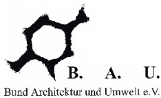
Bund Architektur und Umwelt e.V.