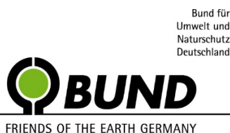
Bund für Umwelt und Naturschutz Deutschland e.V.