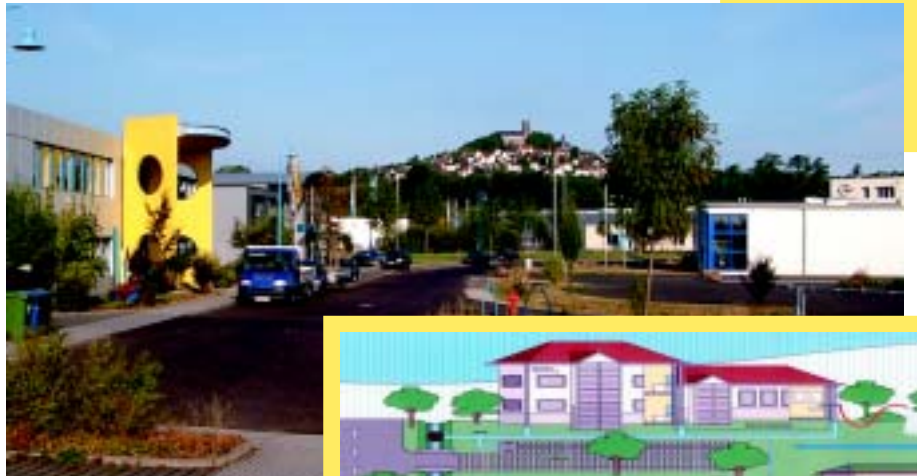
Im Gewerbe- und Umwelt-park Wettenberg wird Regenwasser aufgefangen und sinnvoll genutzt.

Außerdem trägt das System zum Hochwasserschutz bei, da bei starken Niederschlägen weniger Wasser in die Lahn abfließt. Das Projekt wird von der Uni Gießen begleitet. Die Wissenschaftler stellen sicher, dass das Verhältnis von Abfluss, Versickerung und Brauchwasserangebot immer stimmt.