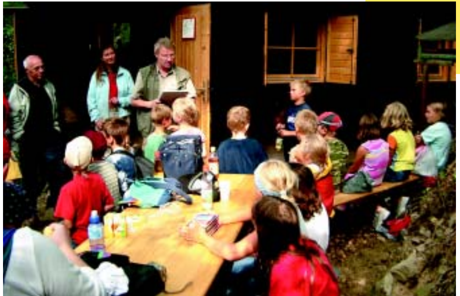
Auch in den Ferien gibt es in Wettenberg ein vielseitiges Freizeitangebot für Kinder und Jugendliche – zum Beispiel die Spielaktion „Natur pur“.

Die abwechslungsreiche Landschaft um Wettenberg bietet Lebensraum für viele Tiere und Pflanzen. Damit das so bleibt, setzen sich die Gemeinde und die Bürger Wettenbergs aktiv für den Schutz von Natur und Landschaft ein. Unter anderem zahlt die Gemeinde Prämien an Landwirte und Privatleute, wenn sie ökologisch wertvolle Gehölze pflanzen oder Grünflächen anlegen. Der Gemeindegewald – über die Hälfte der gesamten Gemarkung - wird umweltfreundlich bewirtschaftet. Die Förster verzichten auf Chemikalien zur Schädlingsbe-