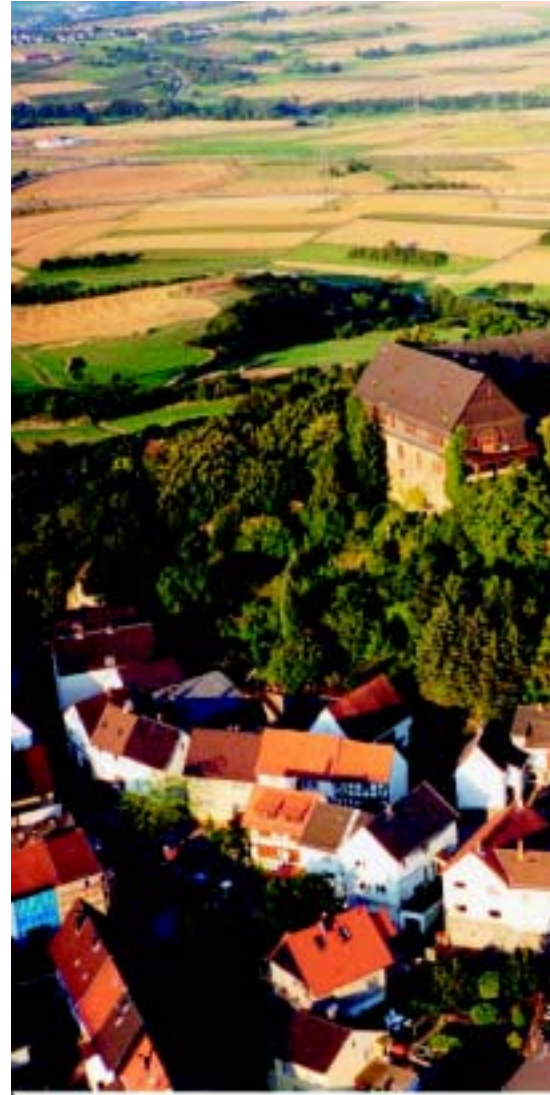
Blick auf die Burg Gleiberg und den gleichnamigen Ort. Rechts: Immer mehr Bürgerinnen und Bürger setzen

Hervorzuheben ist in Wettenberg auch die gute Zusammenarbeit zwischen der Verwaltung, der Politik und den Bürgern. Das Bindeglied ist die verwaltungsinterne Arbeitsgruppe „Lokale Agenda 21 Wettenberg“. Diese Gruppe nimmt an den Sitzungen der ehrenamtlichen Agenda-Gruppen teil und