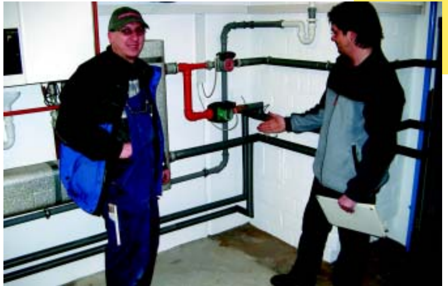
Bei der Vor-Ort-Beratung schlägt der Fachmann Energiesparmaßnahmen vor. Die Gemeinde übernimmt 60 Prozent der Beratungskosten.

ses und schlägt passende Energiesparmaßnahmen vor. In enger Zusammenarbeit mit Architekten und Handwerkern vor Ort entwickelt der Energieberater praxistaugliche Lösungen. Für die Finanzierung legte die Gemeinde – unabhängig von den Fördergeldern des Landes – ein eigenes Programm auf: Die Gemeinde übernimmt 60 Prozent der Beratungskosten. In den Jahren 2002 und 2003 haben 80 Haushalte die Vor-Ort-Beratung in Anspruch genommen.