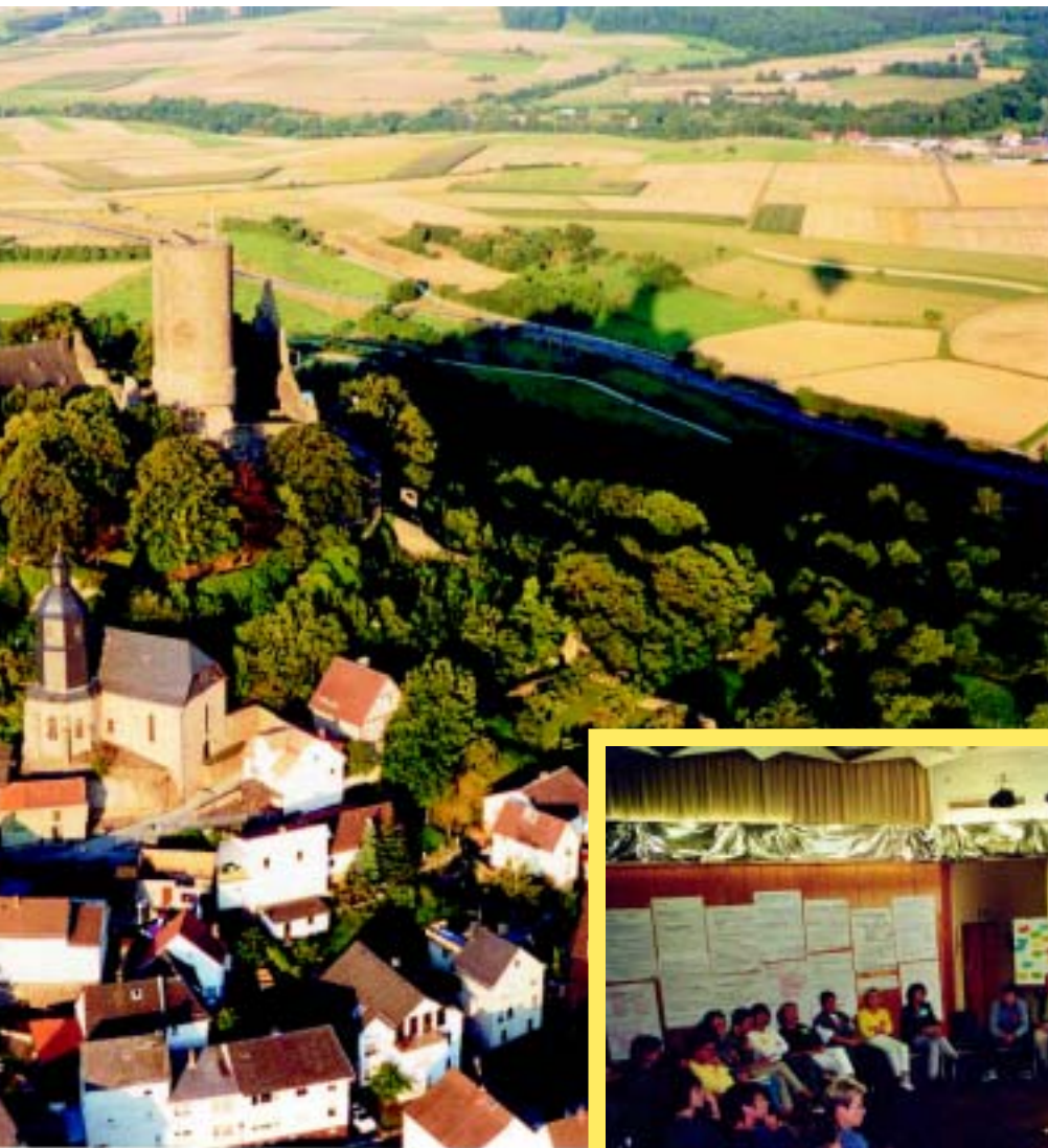
Ortsteil Wettenbergs. n die Lokale Agenda 21 in die Tat um.