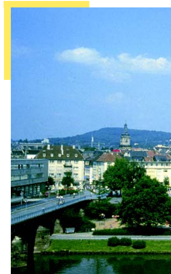
Ansicht der Innenstadt von Saarbrücken und d

Die Umsetzung der Lokalen Agenda 21 in der Stadtverwaltung ist ein zentrales Anliegen des Saarbrücker Agen-