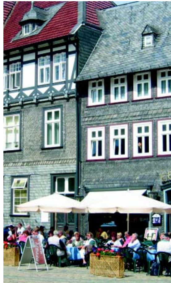
Echte Lebensqualität: Die Goslarer Altstadt lädt zum spannen in historischem Ambiente ein.

Das Ergebnis von anderthalb Jahren intensiver Arbeit konnte sich sehen lassen: Der „Aktionsplan für ein zukunftsfähiges Goslar“ war der erste wichtige Baustein der Lokalen Agenda 21. Er beinhaltet Leitlinien, Problemfelder und Handlungsziele mit dazu passenden Maßnahmen. Der Rat der Stadt