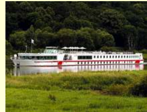
Agnes Sauter Deutsche Umwelthilfe e.V.