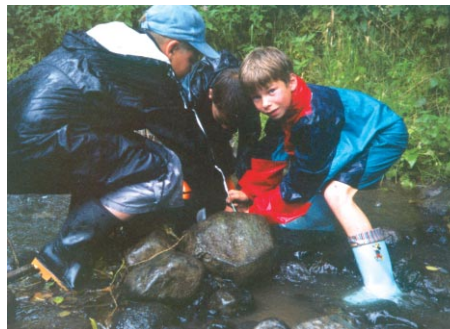
Im Wasser gibt es Interessantes zu entdecken.