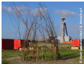
Biomassepark Hugo in Gelsenkirchen

Stillgelegtes Zechengelände Ziele: Öffnung als Grünfläche, Wildniselemente, Aneignung, Umweltbildung