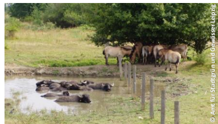
Grüner Bogen Paunsdorf in Leipzig

Stillgelegtes Zechengelände Ziele: Öffnung als Grünfläche, Wildniselemente, Aneignung, Umweltbildung