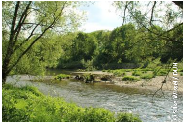
Ruhr in Arnsberg

Flussrenaturierung, Eigendynamik, Wildnis, NSG Ziel: Naturentwicklung und Nutzung in Einklang bringen