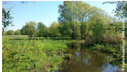
Tiefwerder Wiesen in Berlin-Spandau

Flussrenaturierung, Eigendynamik, Wildnis, NSG Ziel: Naturentwicklung und Nutzung in Einklang bringen